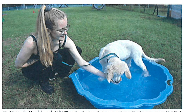
Der Verein der Hundefreunde VdH 08 sorgt mit seinen Trainingsangeboten für ein entspanntes Verhältnis zwischen Mensch und Fellträger.